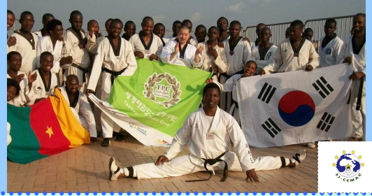
Ci-dessus, des Jeunes de la CEAMC lors d'une session de formation et d'intégration par le sport (Taekwondo) organisée par la SJ-CEMAC à Yaoundé