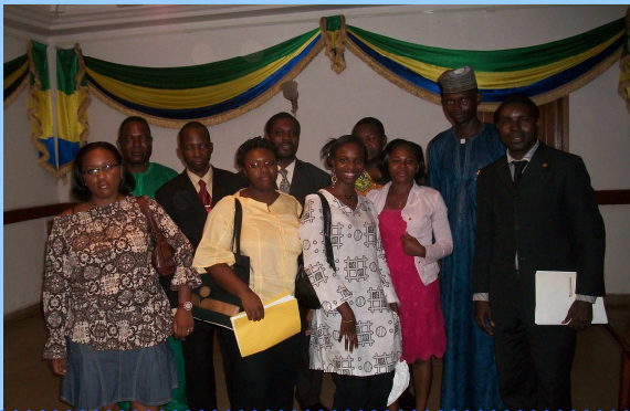
Des jeunes de la CEMAC lors d'une Réunion de Dialogue et de Compréhension Mutuelle sur les stratégies de la SJ-CEMAC, tenue à l'Ambassade de la République du Gabon au Cameroun