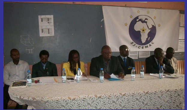
Photo de Famille des "CLUBS CEMAC" du Lycée de la Cité Verte et du Collège la Grâce