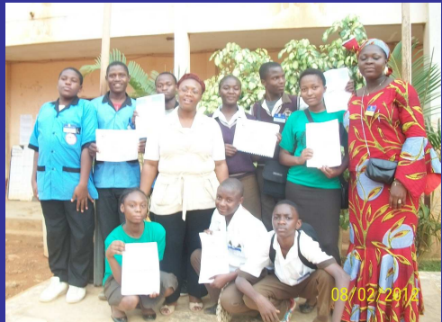
Le Secrétaire Exécutif de la SJ-CEMAC, entouré des « CLUBS CEMAC » du Lycée de Tsinga et du Collège AYUNGHA