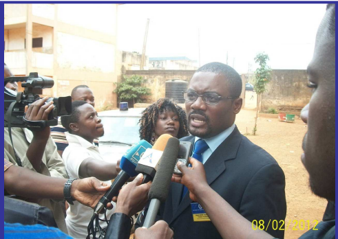
Le Président Fondateur de la SJ-CEMAC répondant aux questions des journalistes après la cérémonie...