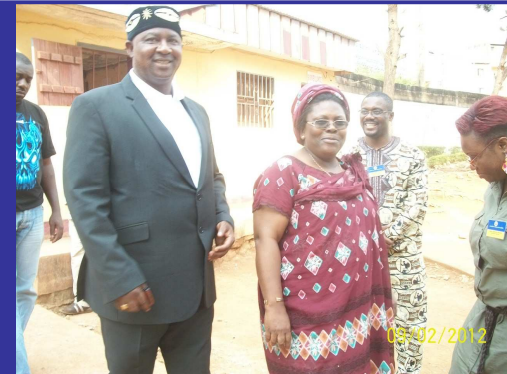
Le Parrain de la « Semaine du Patriotisme Communautaire » et le Proviseur du Lycée de la Cité Verte , à l'arrivée...