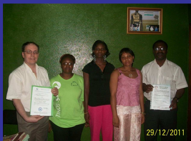
L'Intégration c'est nous !