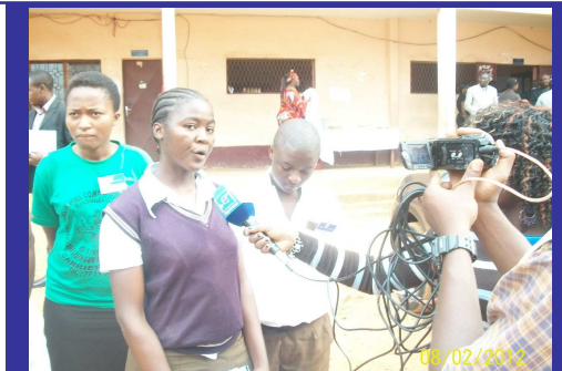
La Présidente du « CLUB CEMAC » du Collège AYUNGHA émettant ses impressions à la presse...