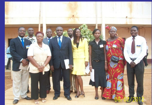
Les Représentants du MINEPAT et les membres du Bureau International de la SJ-CEMAC