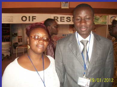
La Diplomatie c'est nous !