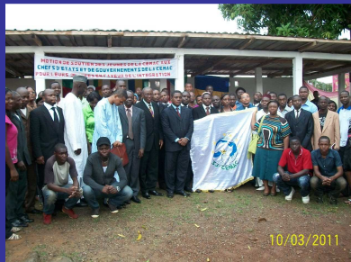
La Diversité c'est nous !