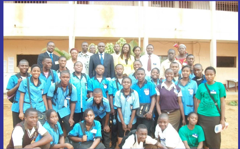
Photo de Famille des "CLUBS CEMAC" du Lycée de Tsinga et du Collège AYUNGHA