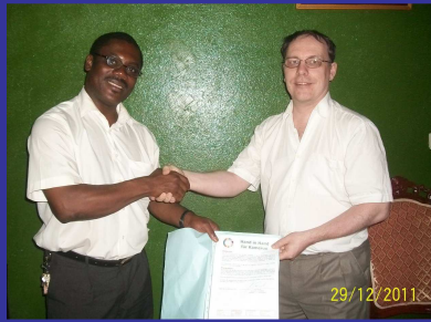
La Coopération c'est nous !