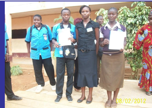
La Déléguée Générale à l'Intégration entourée des Président(e)s des CLUBS CEMAC après installation...