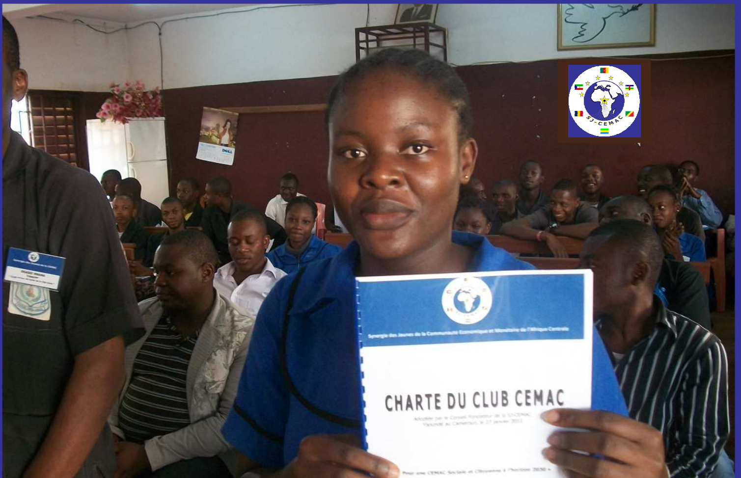
Préparer l'Avenir des générations futures de la CEMAC...