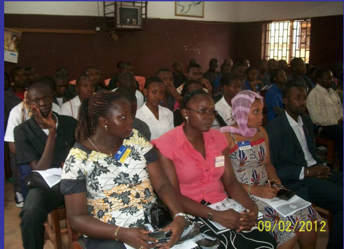
Une vue de face de la salle des cérémonies d'installation officielle des « CLUBS CEMAC »