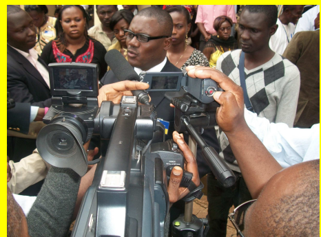
L'Intégration c'est nous !