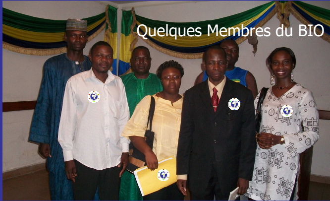
Quelques Membres du BIO

« Je pense, surtout, à la place accordée aux jeunes parce qu'ils garantissent l'avenir de la CEMAC, parce que 50% de la population de la Communauté a moins de 18 ans, parce que les moins de 15 ans représentent 40% de la population de la CEMAC ».