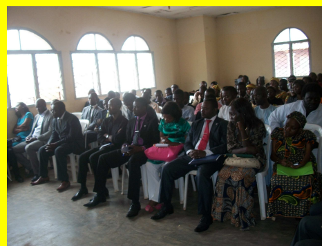
La Diplomatie c'est nous !