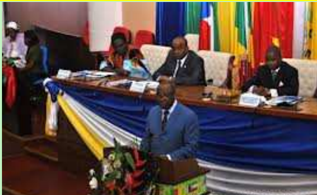
S.E.M Pierre MOUSSA A la Tribune du Parlement de la CEMAC