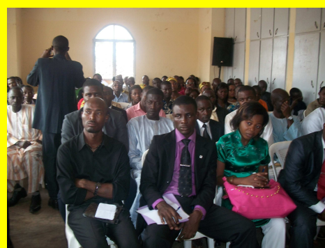
La Coopération c'est nous !