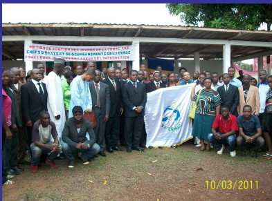
La Diversité c'est nous !