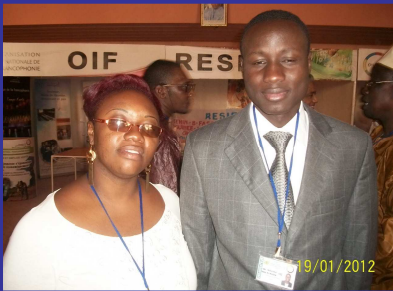
La Diplomatie c'est nous !