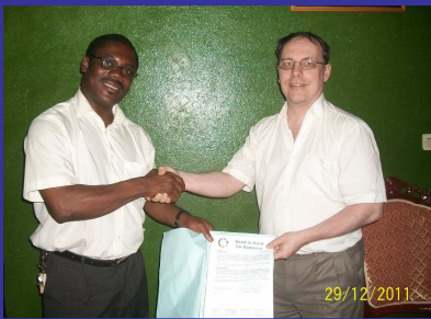
La Coopération c'est nous !