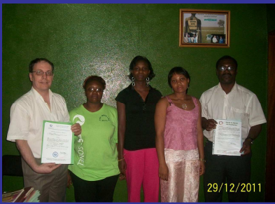
L'Intégration c'est nous !